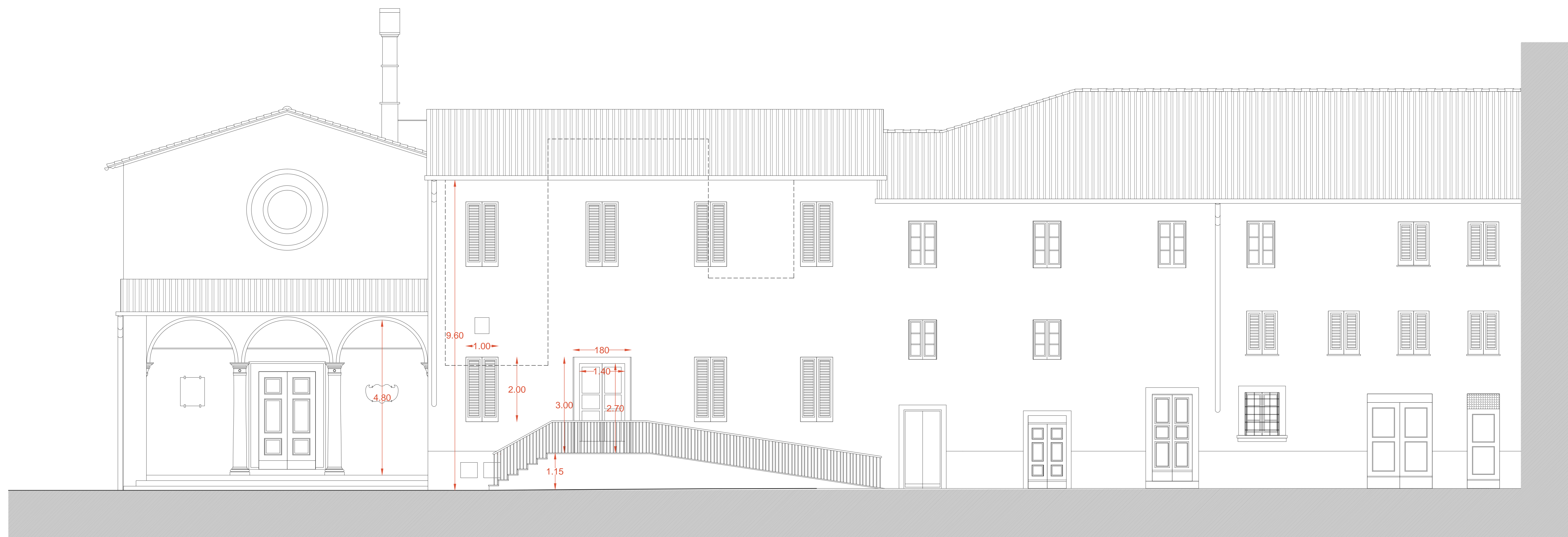
PROSPETTO SU VIA ROMA